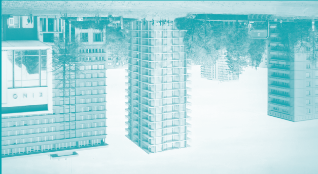
Urban Living Workshop Design, Team Barkow Leibinger ©Barkow Leibinger

SELF-MADE CITY – Best-Practice-Projekte: BARarchitekten, Carpaneto Die Zusammenarbeiter, fatkoehl, ifau und Jesko Fezer + HEIDE & VON BECKERATH, realities:united, zanderroth, Stadtquartier Friesenstraße