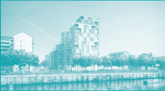
Urban Living Workshop Design, Team COBE Berlin